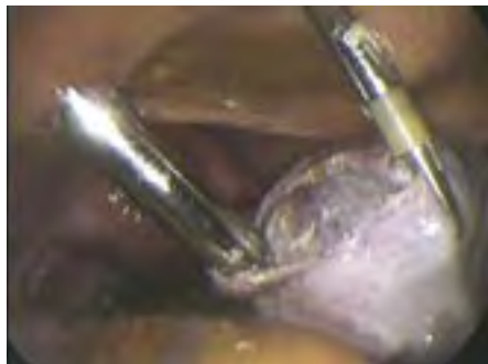
▣ Dermoidcyste ▣

Tijdens de ingreep onderzoekt de gynaecoloog de organen in de buikholte: de baarmoeder, de eileiders en de eierstokken. Ook kunnen de blindedarm, een deel van de lever, de galblaas en een groot deel van de darm gezien worden. Een diagnostische laparoscopie duurt ongeveer een half uur.