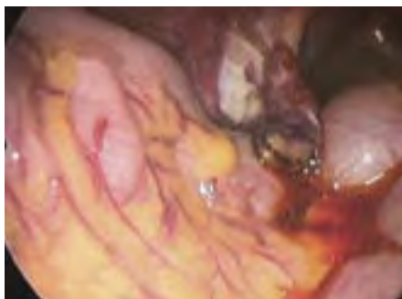
▣ Onderzoek van eileiderdoorgankelijkheid ▣