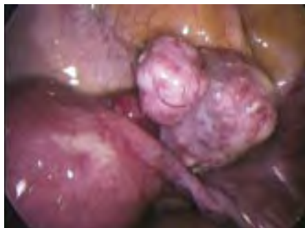
▣ Fibromen van de baarmoeder ▣