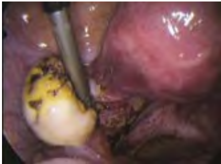
▣ Chocoladecyste ▣