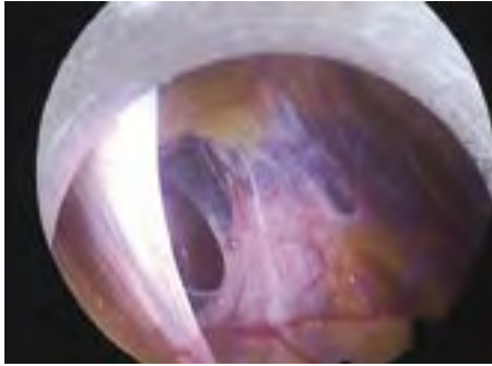
▣ Adhesies van de darmen met de buikwand ▣