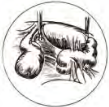
▣ Hydrosalpinx ▣