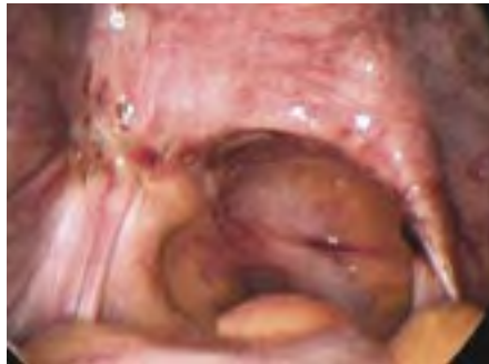
▣ Diepe endometriose ▣