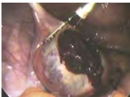
▣ Buitenbaarmoederlijke zwangerschap ▣