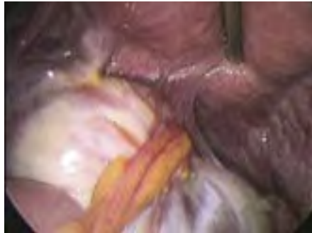
▣ Adhesies van eierstok en eileider ▣