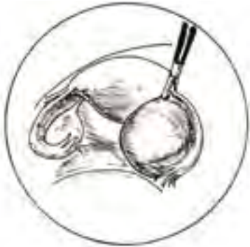
▣ Eierstokcyste ▣