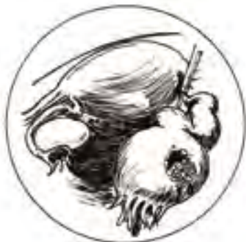
▣ Buitenbaarmoederlijke zwangerschap ▣

onderbuik. Hieronder worden die toestanden en hun mogelijke oorzaken beschreven.