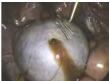
▣ Eierstokbloeding ▣

Wanneer die vergrote eierstok zich om zijn aanhechtingssteel draait, krijg je zeer acute pijn. Dit noemt men een torsie of steeldraai. Een gesteeld fibroom en een hydrosalpinx kunnen ook rond hun aanhechtingspunt draaien met dezelfde acute pijnklachten als gevolg.