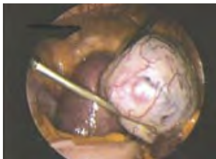
▣ Eierstokgezwel ▣